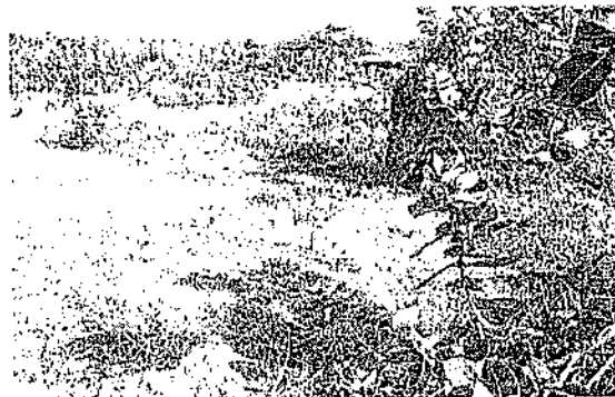
Fotografía No. 1 -Punto No. 2: Ubicado en el sector del denominado Jardín Jerusalén, Con Coordenadas: 11.01732N ; 74.87035W

Se evidencia que no se requiere servidumbre para la conducción distribución del recurso que se pretende aprovechar.