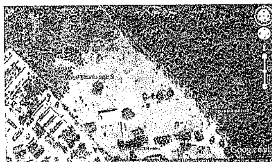
Imagen No. 1 –Imagen satelital de ubicación de los puntos seleccionado para construcción de pozo.

Recomendación 1: N11.01692 W74.86875 metros Altitud: 27 m. Recomendación 2: N11.01732 W74.87035 metros Altitud: 28 m